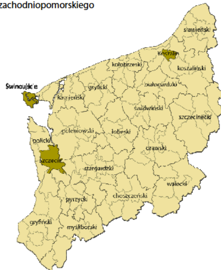
Rysunek 1. Podział administracyjny województwa zachodniopomorskiego

Częścią projektu jest diagnozowanie stanu wiedzy na temat podmiotów i warunków prowadzenia edukacji kulturowej w regionie. W badaniu zostały wykorzystane dane statystyki publicznej, dokumenty urzędowe, informacje z poprzednich diagnoz (wykorzystane w latach 2016-2018).